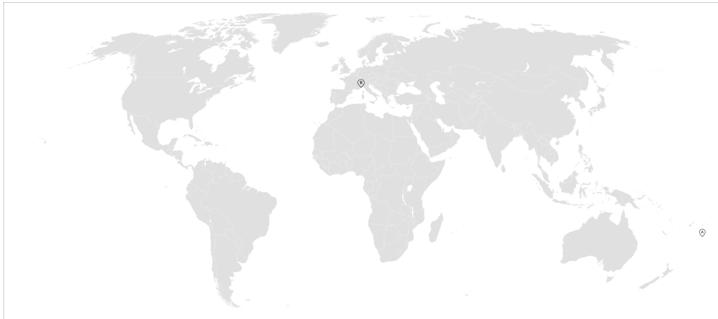
Figura 1: Planisfero con marcatori posizionali